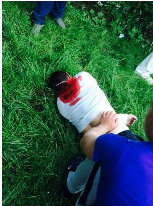
UKROVSKÉ VRAŽDY, V TOM JSOU BORCI