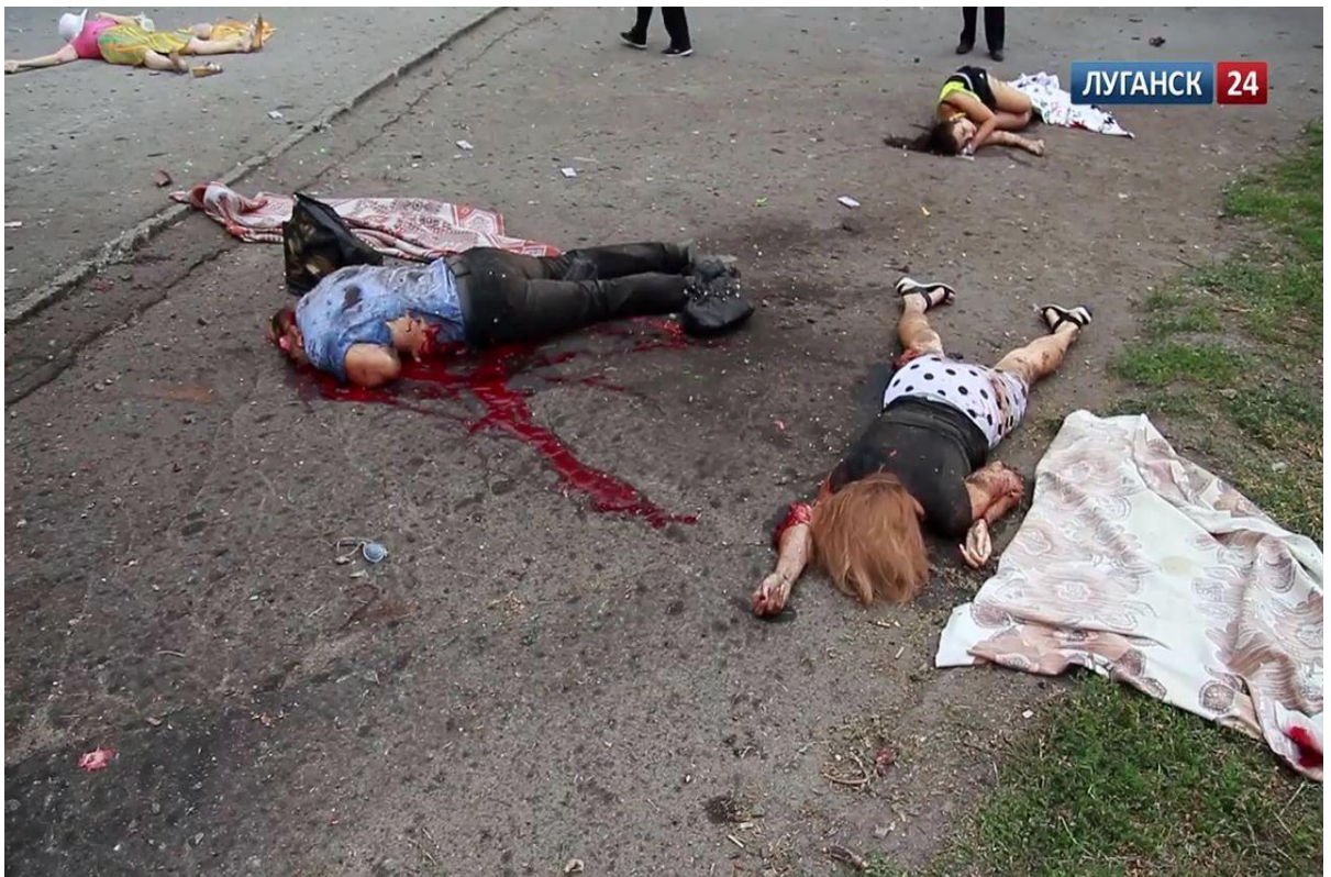
Letecký útok ukr. armády