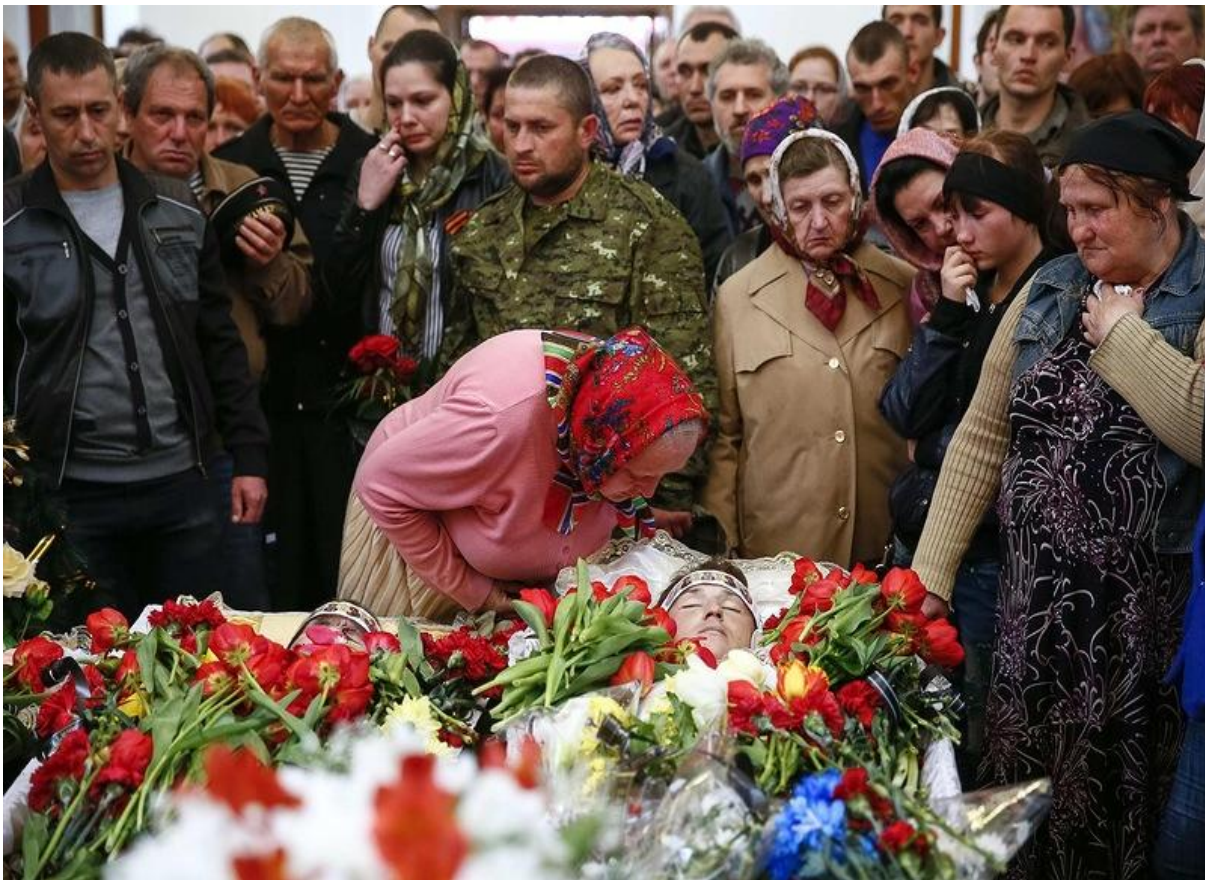
Kyjevská vláda zasévá nenávisť lidí ve východní Ukrajině k západní Ukrajině